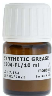
--- 9504-FL fluorescent