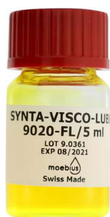
--- 9020-FL fluorescent