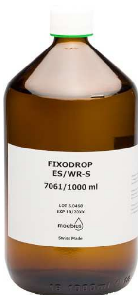
Moebius Fixodrop WR-S