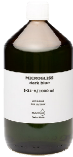
Moebius Microgliss I31