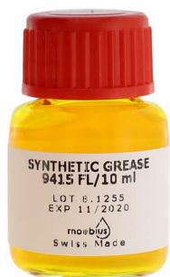
--- 9415-FL fluorescent