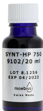
Moebius Synt-HP 750 (9102)