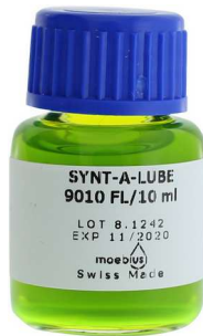
9010-FL fluorescent ---