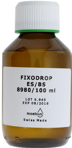
Moebius Fixodrop BS