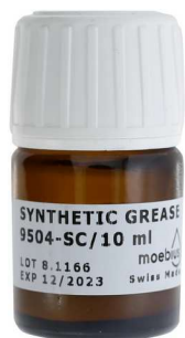
--- 9504-SC sans colorant