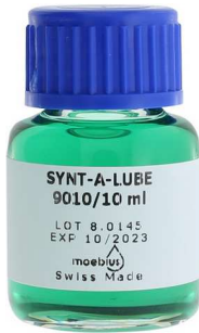
Moebius Synt-A-Lube 9010 - 9014