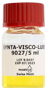
Moebius Synta-Visco-Lube 9027