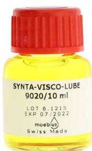
Moebius Synt-Visco-Lube 9020