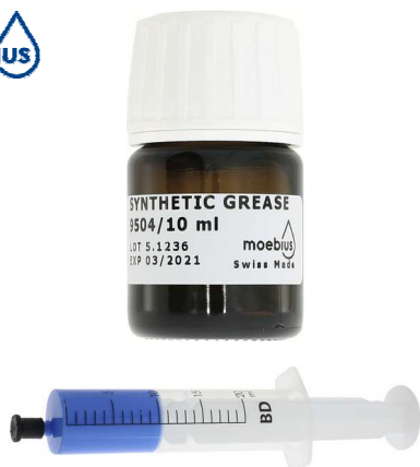
Moebius 9504 * Seringue