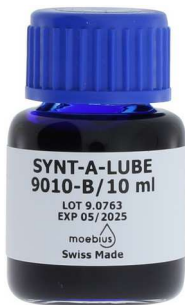
--- 9010-B bleu foncé