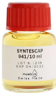
Moebius Syntescap 941