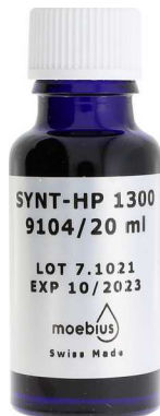
Moebius Synt-HP 1300 (9104)