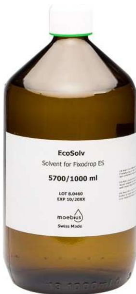
Moebius solvant pour Fixodrop