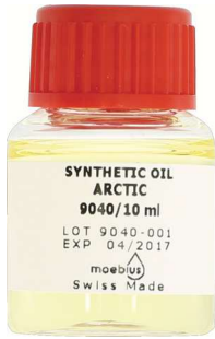
Moebius Arctic 9040