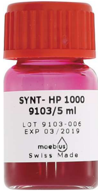
Moebius Synt-HP 1000 (9103)