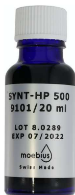
Moebius Synt-HP 500 (9101)