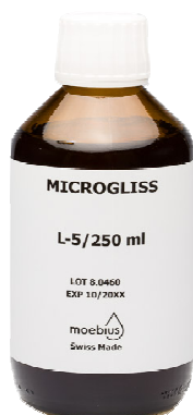
Moebius Microgliss L5