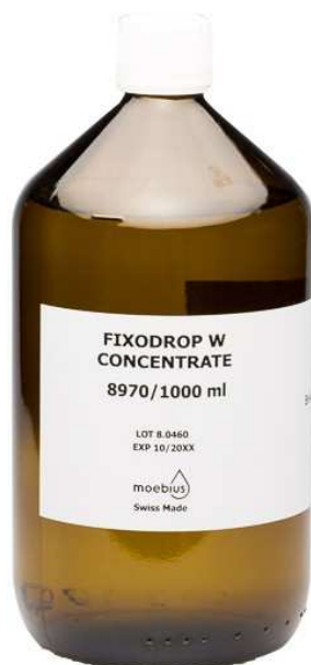
Moebius Fixodrop W