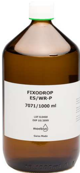
Moebius Fixodrop WR-P