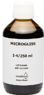
Moebius Microgliss I4